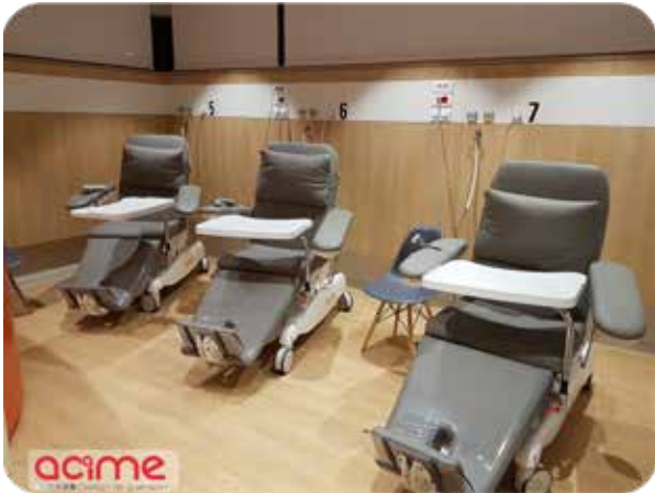
Clinique du tertre rouge, Le Mans