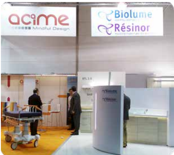
Salon MEDICA, édition 2015