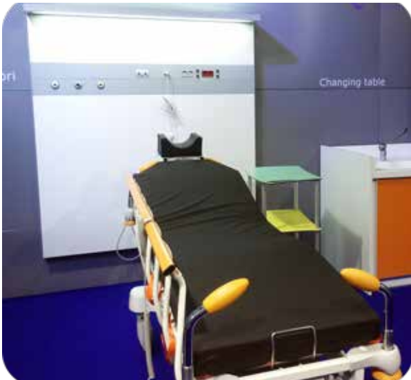
Salon Soins et Santé, édition 2017