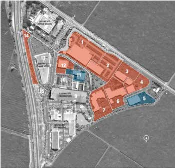
Plan de masse du village santé (HealthScape)